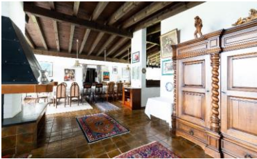
Konservativ-Gehobenes Milieu Die alte strukturkonservative Elite