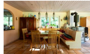
Nostalgisch-Bürgerliches Milieu Die harmonieorientierte (untere) Mitte