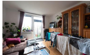
Prekäres Milieu Die um Orientierung und Teilhabe bemühte Unterschicht