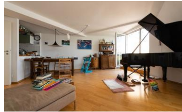
Postmaterielles Milieu Engagiert-souveräne Bildungselite mit postmateriellen Wurzeln