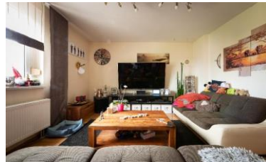
Konsum-Hedonistisches Milieu Die auf Konsum und Entertainment fokussierte (untere) Mitte