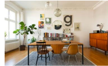
Expeditives Milieu Die ambitionierte kreative Bohème