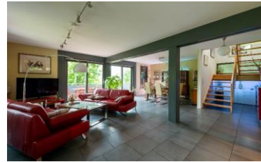
Milieu der Performer Die effizienzorientierte und fortschrittsoptimistische Leistungselite