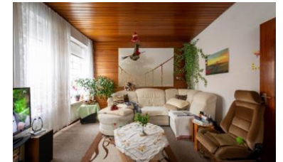
Traditionelles Milieu Die Sicherheit und Ordnung liebende ältere Generation