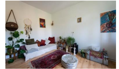
Neo-Ökologisches Milieu Die Treiber der globalen Transformation