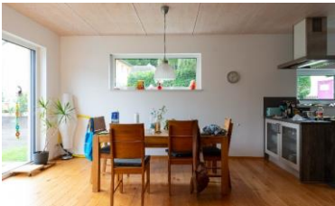
Adaptiv-Pragmatische Mitte Der moderne Mainstream